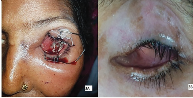
Şekil 3. A) Terebentin yağı uygulamasından sonra dışarı çıkan kurtçuklar, B) 6 hafta sonra iyileşmiş socket