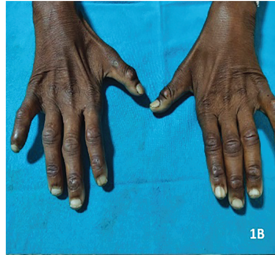
Şekil 1. A) Miyazis ile ilk prezentasyon, B) Kuğu boynu deformitesi