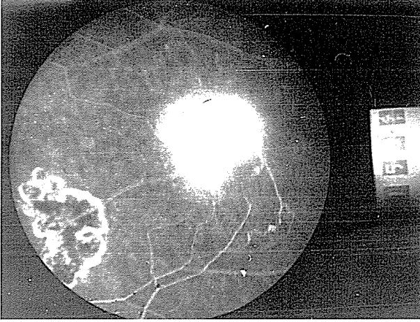
Resim 1A-B. Retinada neovaskülarizasyon ve laser tedavisi sonrası